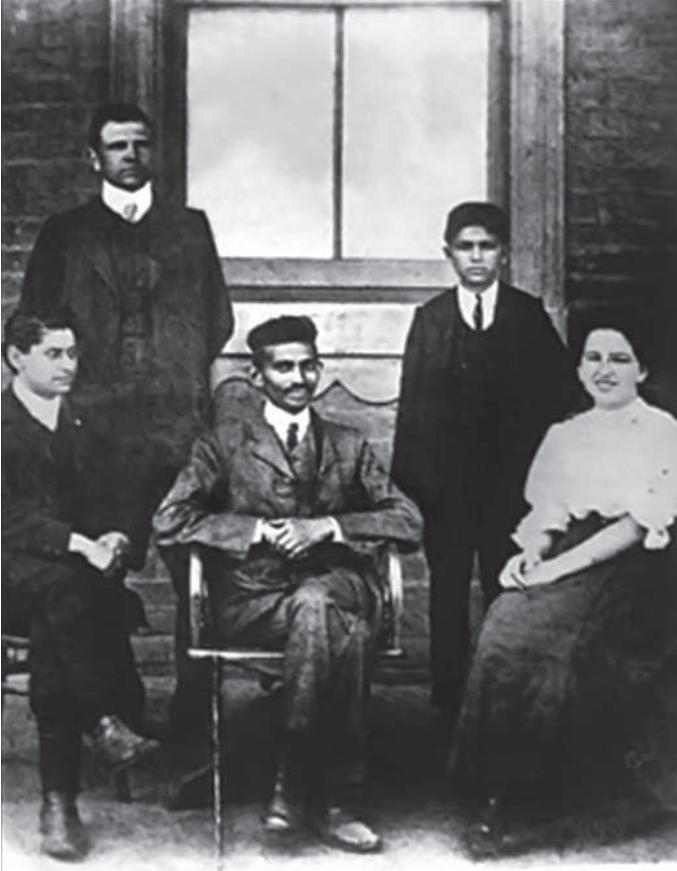
غاندي في أفريقية الجنوبية.

القوانين التي تحجر على حرية العمال الملونين في الإقامة، أو تقتت عليهم في الأجور، أو تسومهم الطاعة لما لا يطاق من الغبن والإجحاف.