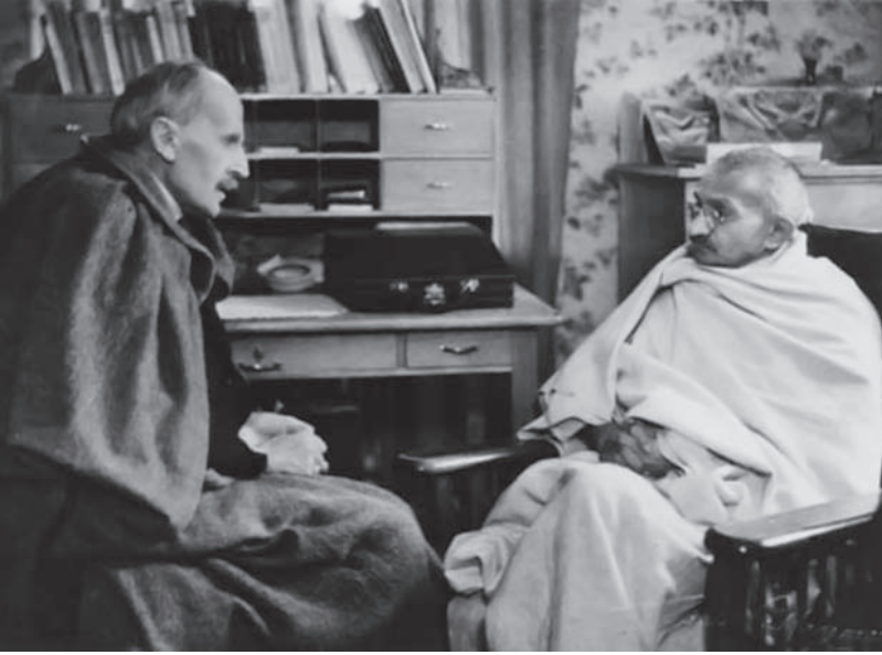
غاندي ورومان رولان.

وإذا كان الإنسان الفرد يجد روحه في كفاح مطالب الجسد وشهواته، فالأمم التي لا اعداد لها تجد روحها في كفاح مطالب الحضارة وشهواتها، أو في هذا الصراع الذي يتلاقى فيه الخير بالشر، والقوة بالضعف، والمعرفة والعلم بالجهل والغباء. وما تعلمت الإنسانية من شيء قط كما تعلمت من الشدائد، وفي مقدمتها الحروب، وهي شر ما يبتلى به الناس.