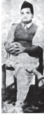
«جودس» قاتل غاندي.

وما نظن أن قاتلاً ضريت نفسه بالشر كما ضريت نفس هذا التعس المفتون، فحسبك نية القتل إذا كان القتل هو غاندي، تلك وحدها كافية.