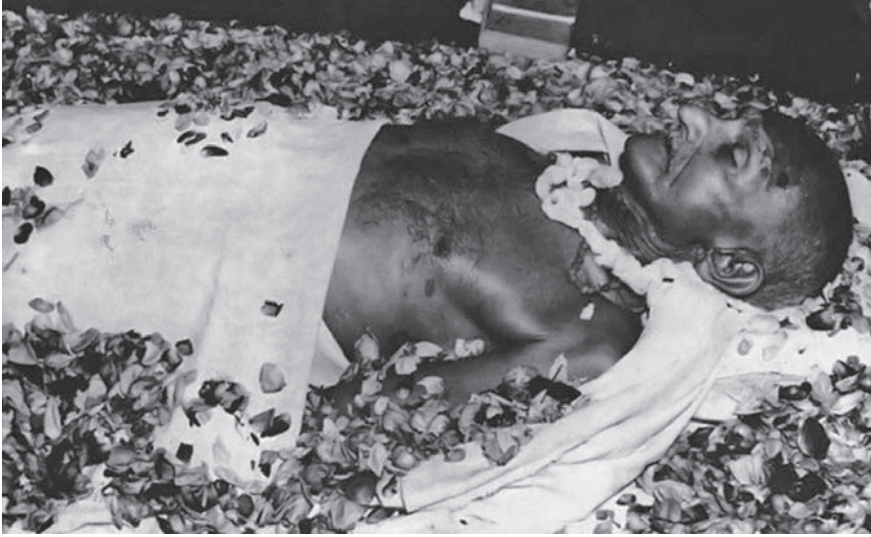
جثمان غاندي على شاطئ النهر المقدس — نهر «جمنا».

غاندي بالصلاة «آي رام. آي رام» ... وسقط إلى الأرض رافعاً يديه كما كان يرفعهما لمن يدعون له بالحياة.