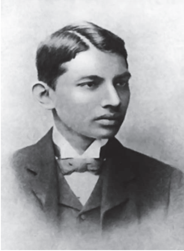
غاندي في الجامعة.

كان بعض الهنود ينقادون لغاندي في حملات المقاومة السلبية؛ لأنهم يؤمنون مثله باجتئاب العنف والتورع من إزهاق كل حياة. لكن عمال الجنوب فيهم صينيون وأندونسيون، وفيهم هنود غير مؤمنين بالنحلة التي يؤمن بها الزعيم، وفيهم زنوج ووثنيون لا يعرفون من الأديان غير أديان الهمجية الأولى.