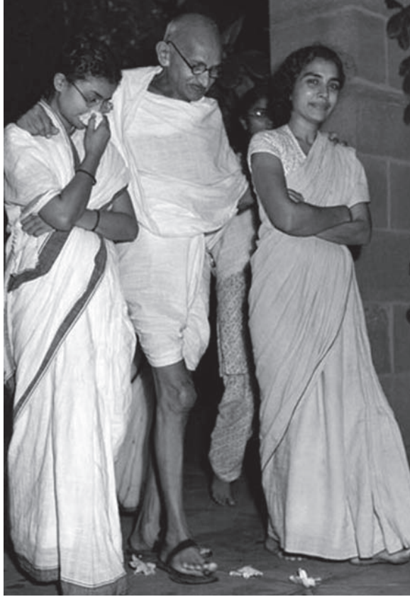
غاندي بين حفيدتيه.

الناحية، وما في كل يوم يجد المسلمون أمامهم زعيماً كغاندي يعتصم بالسماحة في قوة وصدق طوية، ويستطيع أن يروض أتباعه على العدل والرفق وحسن المعاشرة وفض المشكلات بترضية المخالفين في الرأي والعقيدة.