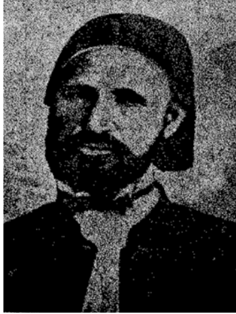
محمد علي باشا الحكيم ١٢٢٨-١٢٩٣هـ.

أتموا دروسهم وقدموا امتحاناتهم الشفاهية، ولم يبقَ عليهم إلا الامتحان الخطي، وهو عبارة عن تأليف رسالة في الطب يقترحها عليهم الأساتذة، فوردت عليهم الأوامر بالعودة إلى مصر، فعادوا فإذا بذلك الأمر قد صدر لهم سهوًا بغير علم العزيز، فأمر بعودتهم إلى باريس لإتمام الامتحان ونيل الشهادة الطبية، فعادوا إليها فامتحنوهم خطأ، فألف المترجم رسالة طبية في الرمد الصيدي المصري، وقعت وقعًا حسنًا لدى أساتذته، فمنحوه الشهادة وعاد إلى مصر سنة ١٢٥٣هـ، وكانت شهرته قد سبقته إليها فتعيّن حال وصوله باش جراح، وأستاذًا للعمليات الجراحية الكبرى والصغرى والتشريح الجراحي، وأنعم عليه محمد علي باشا إن ذاك برتبة صاغقول أغاسي، ولم تمض مدة حتى نال رتبة بكباشي.