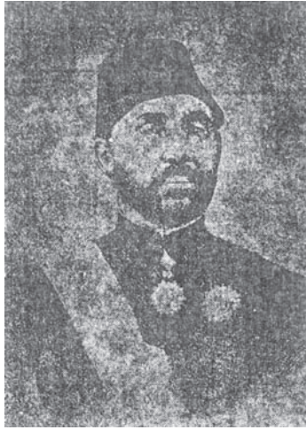
السيد صالح مجدي بك ١٢٤٢هـ-١٢٩٨هـ.

هو من نوابغ أواسط القرن الماضي الذين ارتقوا بذكائهم ونشاطهم إلى مناصب الحكومة، ونبغوا في النظم والإنشاء والترجمة، وكان ذلك صعباً نادراً قبل النهضة الأخيرة.