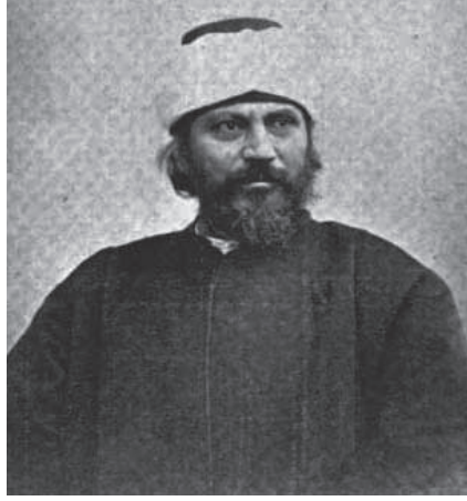
السيد جمال الدين الحسيني الأفغاني.

إلى الفتنة واللبوهم للفساد طلباً للاستبداد بالإمارة، وكان في جيش هراة من إخوة الأمير ثلاثة؛ محمد أعظم، ومحمد أسلم، ومحمد أمين، فانتصر السيد جمال الدين لمحمد أعظم، فلما أحسوا بتدبير الأمير ومشورة الوزير أسرعوا إلى الفرار، وتفرقوا في الولايات، فذهب كل منهم إلى ولايته التي كان يليها من قبل أبيه، وطاشت بهم الفتنة، واشتعلت نيران الحروب الداخلية.