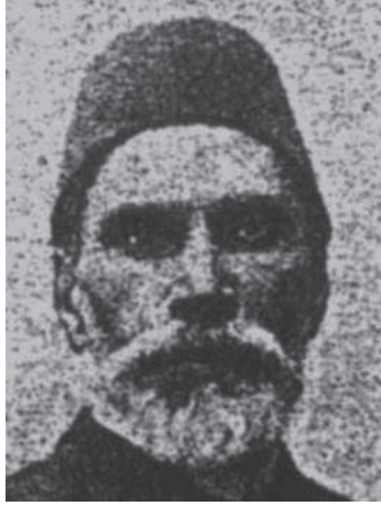
عبد الله باشا فكري ١٢٥٠-١٣٠٧هـ.