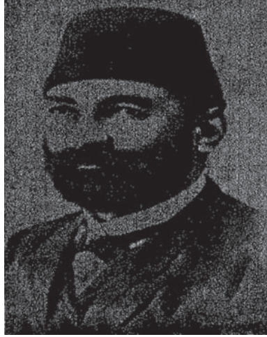
المعلم ناجي ١٢٦٥-١٣١٠هـ.

حقيقة»، ثم جريدة «سعادت»، وأنشأ مجلات شعرية انتقادية — سيأتي ذكرها بين مؤلفاته — وآخر مهمة تقلدها كتابة تاريخ آل عثمان، ففضى فيها بضع سنوات حتى توفاه الله.