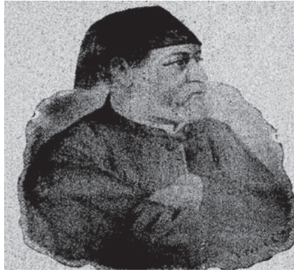
مارييت باشا ١٨٢١-١٨٨٠م.

هو فرانسوا أوغست فردينان مارييت، ولد في بولون سيرمير من أعمال فرنسا في ١١ فبراير سنة ١٨٢١م، وكان أبوه رئيسًا في بعض دوائر الحكومة، فكان يجب أن ينشأ مارييت مرشحًا لمثل هذه الخدمة، ولكنه نشأ ميالًا إلى الأسفار محبًا للاكتشاف منذ نعومة أظفاره، فاتفق له قبل أن يدرك الحُلم أنه دخل دهليزًا تحت الأرض في بولون لا يُعرف آخره، فحدثته نفسه أن يتتبعه إلى آخره، فما زال سائرًا حتى خرج من طرفه الآخر.