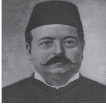
سليم بك تقلا ١٨٤٩م-١٨٩٢م.

فلما أتم دروسه تعين أستاذًا في المدرسة البطريركية في بيروت، يعلّم بها ما أتقنه، ويتقن ما فاته؛ وخصوصًا الفنون العربية، فإنه كان يتلقاها على الشيخ ناصيف اليازجي، وكان الشيخ (رحمه الله) معجبًا بذكائه وحدة ذهنه، وكان يعتمد عليه أحيانًا في شرح بعض الدروس على طلبته؛ دلالة على ثقته به وركونه إلى صحة مبادئه وسمو مداركه، ولم يمض عليه في المدرسة البطريركية مدة حتى صار رأس أساتذتها، ووكيل أعمالها، ومدير شئونها، وألّف في أثناء ذلك كتابًا في النحو والصرف على أسلوب مبتكر طبع ونشر، وكان الاعتماد عليه في تلقي هذين العلمين في المدرسة البطريركية.