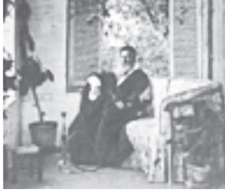
الدكتور فان ديك بلباسه الشرقي.

ولما كان صبح الأربعاء ٢ إبريل (نيسان) سنة ١٨٩٠م سار أعضاء اللجنة إلى دار الأستاذ للقيام بفروض التهئة وتقديم الهدية، فإذا بتلك الدار قد غصت بالفود من المهنيين على اختلاف الأديان والنحل، والدكتور وقرينته جالسان في صدر القاعة يقابلان المهنيين بما جبلا عليه من اللطف والأنس، فدخل أعضاء اللجنة وقدموا له عريضة مكتوبة على رق غزال، تتضمن إحساسات السوريين نحوه وإقرارهم بفضله، وتلاها الرئيس؛ وهاك نصها: