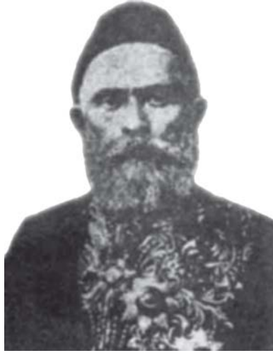
أحمد جودت باشا ١٢٣٨-١٣١٢هـ.

التالية عين عضواً في المجمع العلمي العثماني (الأكاديمية)، وفي سنة ١٢٧١هـ تقلد كتابة وقائع البلاد، وفي السنة التالية عين قاضياً لغلطة أحد أقسام الأستانة الثلاثة. وكان كلما تقلد منصباً قام بمهامه حق القيام، فانهالت عليه الرتب والمناصب والنياشين فنال سنة ١٢٧٣هـ باية ولاية مكة المكرمة والنيشان المجيدي من الرتبة الثالثة، وتعين عضواً في مجلس التنظيمات، ورئيساً للقومسيون المنعقد إذ ذاك لترتيب القوانين والنظامات المتعلقة بالأراضي، وكان في جملة أعضاء هذا القومسيون - وقتئذ - محمد رشدي أفندي شوراني الذي صار - بعدئذ - والياً على سورية، ثم ناظراً للمالية، ثم صدرًا أعظم.