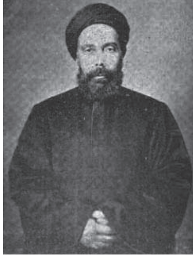
السيد عبد الله نديم ١٢٦١هـ-١٣١٤هـ.

أسابيع حتى استُخدم تلغرافياً (أو تلغرافجياً) في مكاتب مختلفة؛ أهمها مكتب تلغراف القصر العالي الخاص على عهد عزيز مصر المغفور له إسماعيل باشا الخديوي الأسبق.