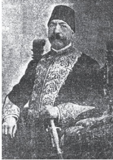
إبراهيم بك المويحي ١٢٦٢هـ-١٣٢٣هـ.

مهنته، وهي يومئذ مهنة الفقراء ... ولكن الأقدار ساقته إلى الاشتغال بها في كهولته فكان من أعظم نوابغها.