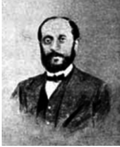
فرنسيس فتح الله مراش ١٨٣٦-١٨٧٣ م.

للفحص لنيل الإجازة، بل اضطر أن يقفل راجعًا إلى حلب وهو عليل ومكفوف البصر أو يكاد، ولم يزل مقيمًا بحلب إلى أن توفاه الله في أواسط سنة ١٨٧٣ م.