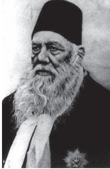
السيد أحمد خان ١٨١٧م-١٨٩٨م.