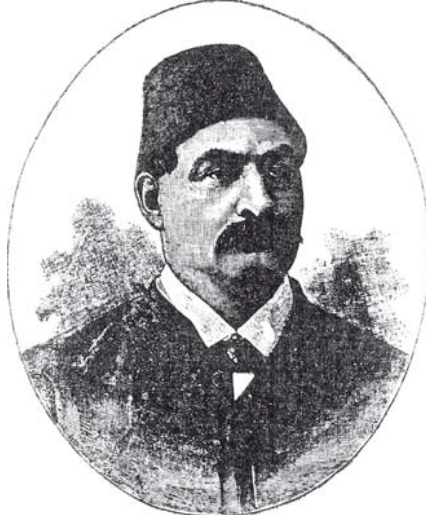
الدكتور دري باشا ١٢٥٧هـ-١٣١٨هـ.

بأمر المغفور له سعيد باشا، فخرجوا إليها واصطفوا أمام الديوان ينتظرون ما لا يعلمون، حتى خرج إليهم المرحوم سعيد باشا بنفسه في أبهة ملكه ومعه المرحوم الدكتور محمد بك شافعي الحكيم ناظر المدرسة الطبية وغيره، وفرز التلامذة بنفسه فجعلهم ثلاثة أقسام بحسب أعمارهم؛ فحديثو السن جدًّا أمر بطردهم من المدرسة، والمتوسطون أن يلحقوا بالشوشخانة السعيدية (أورطة عسكرية)، والمتقدمون ألحقهم بالمدرسة العسكرية الحربية في بلدة طره، وكان صاحب الترجمة من المتوسطين في السن فألحق بالعسكرية، فصرفت لهم الملابس العسكرية والجربنديات، وأقفلت مدرسة الطب، وخلت المدارس المصرية من علوم الطب والأطباء.