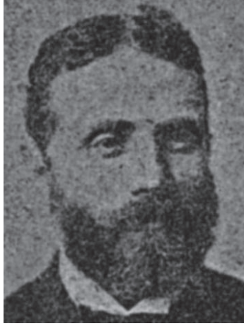
سليم بسترس ١٨٢٩م-١٨٨٣م.

وبتغيير عناصر التعصب، واتباع السنن العمومية؛ إذ هي مفتاح الترقى، وأن أفراد الرجال هم الذين يثون الآراء الصحيحة بين الناس بكتاباتهم وكلامهم وقدمتهم»، وقد عرّب عدة روايات قصد بها استصلاح العادات، وبث الآراء الصحيحة، والاحتفاظ بالآداب، جعلها أقاصيص يصبو الناس إلى مطالعتها.