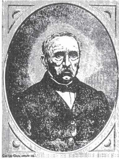
الدكتور كلوت بك ١٧٩٣-١٨٦٨ م.

تفي بما تجنح إليه نفسه، ولا تروي مطامعه، فنزح إلى مرسليليا رغم إرادة والدته التي كانت كثيرة التعلق بولدها؛ هذا لأنه كان وحيدياً لها، ولكنه أصراً على عزمه، وضغط على عواطفه؛ طلباً للعلی وسعياً وراء العلم، وهو لا يملك إلا بعض الدريهمات وشيئاً من الثياب، على أنه لم يلاق في مرسليليا إلا الخيبة، فحدّثته نفسه أن يسافر في سفينة جراحاً لبحارتها، ويتحمل مشاقّ الأسفار وأخطارها سداً لعوزه وهو في التاسعة عشرة من سنه، فلم يقبله ربّانها، وكان ذلك لحسن حظ المترجم؛ لأن السفينة غرقت في ذلك السفر.