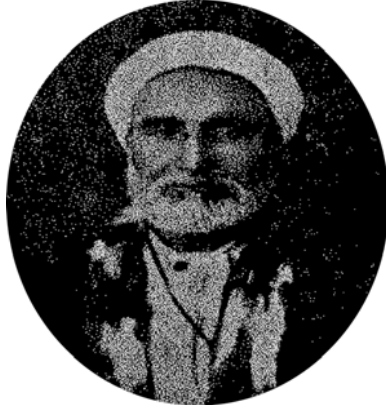
الشيخ يوسف الأسير ١٢٣٠هـ-١٣٠٧هـ.

عنه العلم كثير من أفاضلهم، وأخيراً اختار الإقامة في بيروت لجودة هوائها، فهرعت إليه الطلبة، وكثر مريدوه، وتولى في أثناء ذلك رئاسة كتابة محكمة بيروت الشرعية في أيام قاضيها مصطفى عاشر أفندي، ثم تولى الفتوى في مدينة عكا، ثم تعيّن مدعيًا عموميًا في جبل لبنان على عهد متصرفه داود باشا، ثم انتقل إلى الآستانة العلية وتولى رئاسة التصحيح في دائرة نظارة المعارف، وتعيّن في الوقت نفسه أستاذًا للغة العربية في دار المعلمين الكبرى.