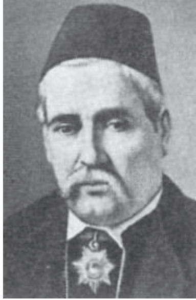
بطرس البستاني ١٨١٩-١٨٨٣م.

وكان صاحب الترجمة قد بلغ العشرين من سنّه، فأراد غبطة بطريك الطائفة المارونية إذ ذاك إرساله مع رفيقه إلى رومية للتبحر في العلوم الدينية، وكان والده قد توفي فعارضت والدته في إبعاده، فتعيّن مدرسًا في مدرسة عين ورقة مشمولًا بأنظار البطريرك، وكان البطريرك يعهد إليه قضاء بعض المصالح إلى سنة ١٨٤٠م، وكانت حال الجبل في اضطرابٍ لَمَّا كان في نفس الدولة العليّة على الأمير بشير وإبراهيم باشا، وكانت الدول الإفرنجية قد بعثت مراكبها إلى سواحل سورية تعين الباب العالي على إخراج إبراهيم باشا منها، وكان صاحب الترجمة قد درس اللغة الإنكليزية في بيروت أثناء إقامته بمدرسة عين ورقة وبعدها، فاستخدمه الإنكليز للترجمة، وكان دعاة المذهب الإنجيلي من الأميركيين قد أخذوا في الإقامة ببيروت للتعليم ونشر مذهبهم، فتعرف إلى بعضهم، وجعل يختلف إليهم يعلمهم اللغة العربية، ويعرّب لهم بعض الكتب، حتى تمكّنت علائق المودة بينه وبينهم، ووافقهم على مذهبهم.