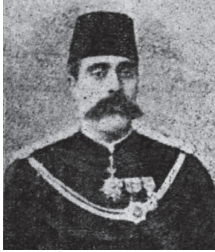
محمد مختار باشا المصري ١٨٣٥م-١٨٩٧م.

جعل الأشهر في كل سنة منها متناسقة على ما يقارن أول كل شهر عربي، وبإزاء كل شهر أهم الحوادث التاريخية التي وقعت فيه؛ وخصوصاً الحوادث الإسلامية والمصرية، بحيث يصح أن يكون هذا الكتاب تقويمًا حسابيًا يوميًا، ومعجمًا تاريخيًا لألف وخمس مئة سنة هجرية، وقد جعله مقدمة لسمو الخديوي عباس باشا الثاني.