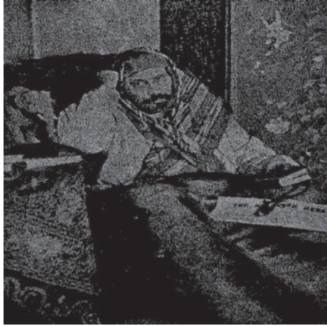
السيد جمال الدين الأفغاني في حال مرضه.

العظيم على ٣٢ كيلومترًا من طهران، فأذن له فتبعه جمٌّ غفير من العلماء والوجهاء، وكان يخطب فيهم ويستحثهم على إصلاح حكومتهم، فلم تمض ثمانية أشهر حتى ذاعت شهرته في أقاصي بلاد الفرس، وشاع عزمه على إصلاح إيران، فخاف ناصر الدين عاقبة ذلك فأنفذ إلى شاه عبد العظيم خمس مئة فارس قبضوا على جمال الدين، وكان مريضًا، فحملوه من فراشه وساقوه يخفّره خمسون فارسًا إلى حدود المملكة العثمانية، فعظم ذلك على مريديه في إيران فثاروا حتى خاف الشاه على حياته.