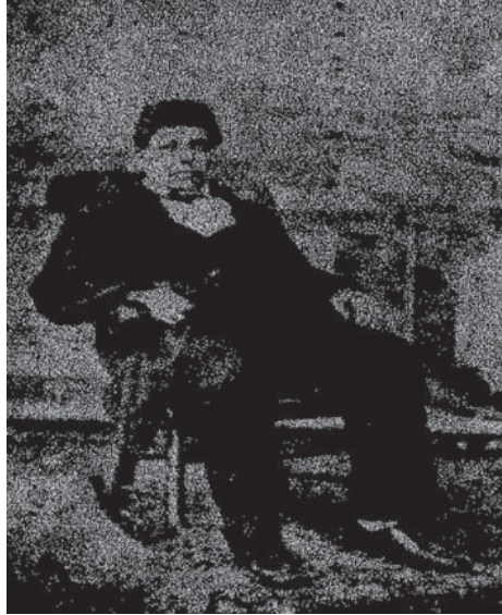
نوفل نعمة الله نوفل الطرابلسي ١٨١٢م - ١٨٨٧م.

بنعمة الله نوفل والد المترجم، فأمر بإعدامه، ثم عاد إبراهيم إلى طرابلس وقد تقدم إليه بعضهم أن يتفحص ما بلغه عن المقتول، فبحث فتحقق براءة الرجل وأن الأمر كان وشاية، فاستقدم صاحب الترجمة، وكان معتزلاً في منزله حزيناً، فأكرمه ودفع إليه مالاً كثيراً، وخلع عليه خلعاً سنياً، وأرسل بعض رجال معيته ليعزي والدته، ويعدها بالانتقام من الواشين جبراً لقلبها الكسير، وقد فعل.