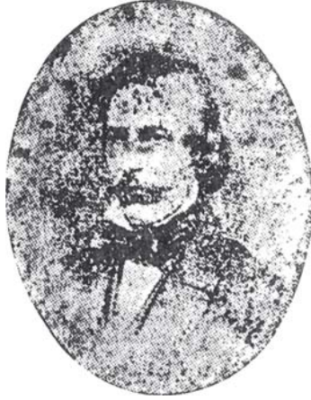
الدكتور كرنيليوس فان ديك ١٨١٨م-١٨٩٥م.

فلما أنس في الغلام ذلك الاجتهاد أخذته الحمية ودعاه إليه، وأباح له مطالعة كل ما يريده من الكتب، فأكبَّ على المطالعة يغترف العلم اعتراف الظمآن للماء الزلال، وكان في تلك المكتبة كتاب في علم الحيوان للعالم كيفيه الشهير، فدرسه حتى تفهّمه جيدًا، ثم درس بنفسه كل ما تيسّر له الوصول إليه من حيوان بلاده.