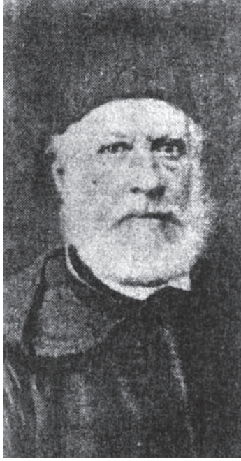
أحمد فارس الشدياق ١٨٠١م-١٨٨٧م.

وكان صاحب الترجمة شديد التعلق بأخيه هذا، فعظم عليه أمره حتى كره الإقامة في بلاد الشام جملة، فغادرها ناقماً عليها وعلى الذين كانوا سبباً في موت أخيه أسعد، وطلب الاغتراب فجاء الديار المصرية في عهد المغفور له محمد علي باشا، وكان مجيئه إليها بصفة أستاذ للمرسلين الأميركيين لتعليم اللغة العربية وقواعدها وأشياء أخرى، وقد أرسله لذلك المرسلون الأميركيين ببيروت؛ لأنهم شعروا بأن موت أخيه أسعد إنما كان دفاعاً عن مذهبهم، وكان أسعد مضطهداً من أكثر أعضاء عائلته إلا جماعة منهم لم يكونوا يستطيعون المجاهرة في الدفاع عنه؛ خوفاً من سطوة الحكام؛ لأنهم كانوا موافقين للأكليروس بما أتوه بشأن المرحوم أسعد، أما فارس فإنه لم يكن يكتف ما في نفسه من استصواب عمل أخيه، فأصبح في خطر على حياته، فحماه الأميركيين ثم أرسلوه إلى مصر — كما قدمنا.