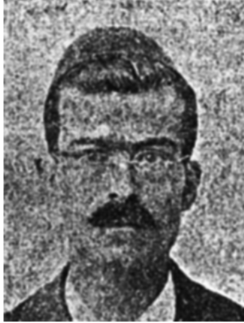
الشيخ نجيب الحداد ١٨٦٧م-١٨٩٩م.

والثلاثين من عمره، وكان (رحمه الله) ذكي الفؤاد، سريع الخاطر، متوقد الذهن، كما سترى من أمثلة نظمه ونثره.