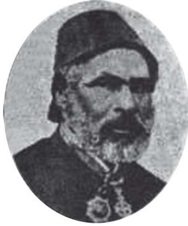
محمود باشا الفلكي ١١٢٠هـ - ١٣٠٣هـ.

في مباشرة هذا العمل - وهو أول من باشره من المصريين - فرسم خريطة الوجه البحري رسمًا مدققًا يدل على طول باعه ومهارته في التخطيط والهندسة، وهي خريطة مشهورة باسمه، يرجعون إليها عند التدقيق، ولعلها أول مؤلف وضعه، ثم أرفده بمؤلفات أخرى بين رسائل وكتب، بعضها في العربية وبعضها في الفرنسية، وهك أسماؤها ومواضيعها: