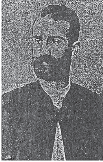
أديب إسحق ١٨٥٦م-١٨٨٥م.

اجتمع من نظمه نحو ألف بيت؛ أكثرها في الغزل والنسيب، وبعضها في المدح والعتاب والرتاء وغيره، وقد تشتت معظمها.