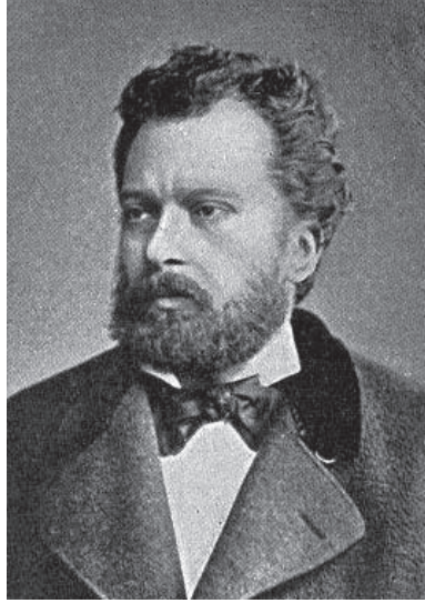
محمد نامق كمال بك ١٢٥٦هـ-١٣٠٦هـ.

ومن ذلك الحين أخذت الآداب الحديثة في الانتشار هناك، وكثر أشياعها ومدعوها، واتفق إذ ذاك سفر العلامة شناسي مؤسس جريدة «تصوير أفكار» إلى باريس لدواعٍ اقتضت ذلك، فعهد بإدارة جريدته إلى كمال بك (سنة ١٢٨١هـ)، وكان في ريعان الشباب، فاعتزل العلم والشعر، وانقطع إلى السياسة بالرغم عنه، ولا يخفى ما في ذلك من التكلف والمشقة مما لا يفلح فيه إلا نوابغ الرجال القادرون على تكييف مواهبهم حتى تطابق وظائفهم، ولو اقتصر صاحب الترجمة على نظم الشعر لبلغ منه مبلغاً فاق به (نفعي) الشاعر الشهير، ولكنه لو فعل ذلك ما استطاع ما استطاعه من خدمة ملته ووطنه خدمة كان يسعى في سبيلها ليله ونهاره.