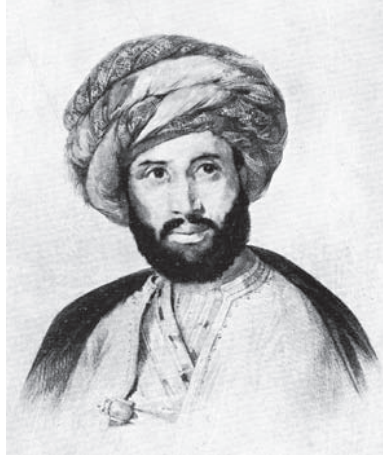
رفاعة بك رافع الطهطاوي ١٢١٦-١٢٩٠هـ.

دروسه تعيّن سنة ١٢٤٠هـ إمامًا في بعض آليات الجند براتب يساعده على القيام بأود حياته.