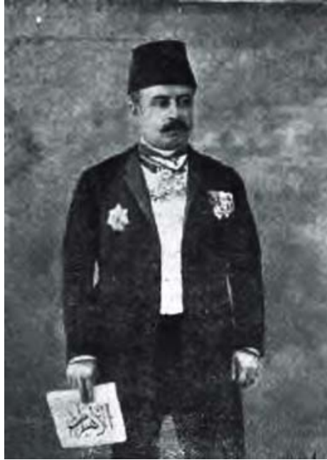
بشاره باشا نقلا.

وكان سليم الذمة صادق الوعد، ومما يذكره العارفون من هذا القبيل أن والده توفي عن دَيْن عليه، ولم يكن أصحاب الدين ينتظرون الوفاء من أولاده، فلما أنعم الله عليهم وسهّل لهم أبواب الرزق اتفق الإخوة، وصاحب الترجمة في مقدمتهم، على وفاء ما في ذمة والدهم من أموال الناس، فسافر هو بنفسه إلى بلاد الشام، ولاقى الدائنين ودفع إليهم أموالهم.