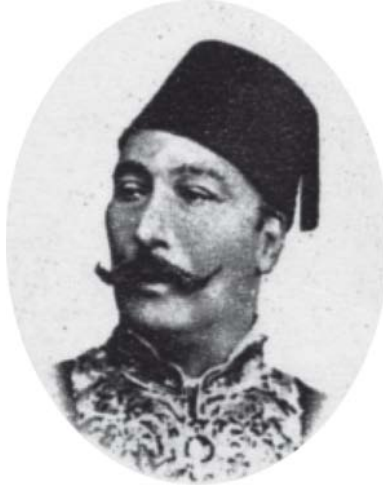
محمود باشا سامي البارودي ١٨٤٠-١٩٠٤م.