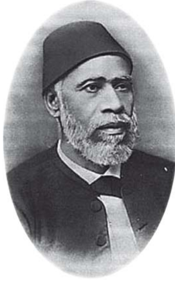
علي باشا مبارك ١٢٣٩هـ - ١٣١١هـ.

ولم يكن والده يكره تعليمه، ولكنه يؤدُّ بقاءه قريباً منه، ثم جاء بعد ذلك ناظر تلك المدرسة لانتخاب أنجب التلامذة وادخالهم في مدرسة قصر العيني - ولم تكن فيها دراسة الطب بعد - فكان عليُّ من المنتخِبين؛ لذكائه وفطنته، فدخل تلك المدرسة سنة ١٢٥١هـ، وسنُّه ١٢ سنة فقط.