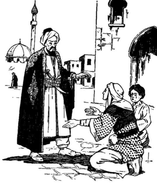
«الوزير يطمئن أم الطفل».