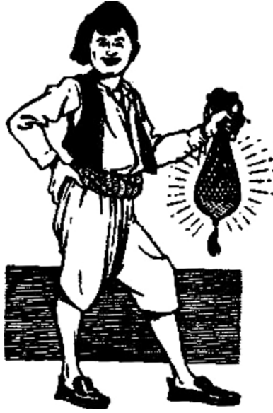
«الطفل وهو فرح بمكافأته وتقدير ذكائه».

وَقَدْ أَخَذَ الطُّفْلُ هَذِهِ الْمُكَافَأَةَ فَرِحًا، وَشَكَرَ الْخَلِيفَةَ «هَارُونَ الرَّشِيدَ» عَلَى تِلْكَ الْمُكَافَأَةِ، وَدَعَا لَهُ، ثُمَّ انْصَرَفَ إِلَى بَيْتِهِ مَسْرُورًا، لِيَقُصَّ عَلَى أَهْلِهِ وَأَصْحَابِهِ ذَلِكَ الْخَبَرَ السَّارَّ.