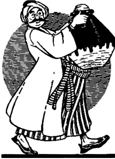
«علي كوجيا يحضر جرة الزيتون أمام الخليفة».

فَلَمَّا سَمِعَ التَّاجِرُ «حَسَنٌ» ذَلِكَ، وَرَأَى التُّهْمَةَ فَذُ لَصَقَتْ بِهِ، وَكُشِفَ الْغِطَاءُ عَنْ خِيَانَتِهِ، أَخَذَ يَتَوَسَّلُ إِلَى الْخَلِيفَةِ أَنْ يَعْفُوَ عَنْ جَرِيمَتِهِ الَّتِي ارْتَكَبَهَا. فَلَمْ يَنْطِقِ الطُّفْلُ بِحُكْمِهِ الَّذِي نَطَقَ بِهِ لَيْلَةَ أَمْسِ، بَلْ قَالَ لِلْخَلِيفَةِ: «لَقَدْ كُنْتُ أَمْرَحُ مَعَ أَصْحَابِي — لَيْلَةَ أَمْسِ — حِينَ أَضْدَرْتُ حُكْمِي. أَمَّا الْيَوْمَ فَلَأْمُرُ جِدًّا لَا هَزْلًا. وَلَيْسَ لِي الْحَقُّ فِي أَنْ أَنْطِقَ بِحُكْمٍ يَقْضِي بِحَيَاةِ رَجُلٍ أَوْ مَوْتِهِ. وَالْأَمْرُ إِلَيْكَ — يَا أَمِيرَ الْمُؤْمِنِينَ — فَاحْكُمْ بِمَا تَرَى. فَإِنْ شِئْتَ أَمَرْتُ بِصَلْبِهِ، وَإِنْ شِئْتَ عَفَوْتُ عَنْ جَرِيمَتِهِ!»