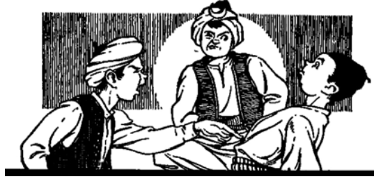
«أطفال يمثلون مشاجرة علي كوجيا والتاجر حسن».

فَقَالَ لَهُ الْقَاضِي: «لَا تُقْسِمَ بِإِلَهِ — أَيُّهَا الرَّجُلُ — فَلَسْنَا مُحْتَاجِينَ إِلَى قَسَمِكَ.» ثُمَّ التَفَّتِ الْقَاضِي إِلَى «عَلِيٍّ كُوجِيَا»، وَقَالَ لَهُ: «أَنَا أُرِيدُ أَنْ أَرَى جَرَّةَ الزَّيْتُونِ، فَهَلْ أَحْضَرْتَهَا مَعَكَ؟»