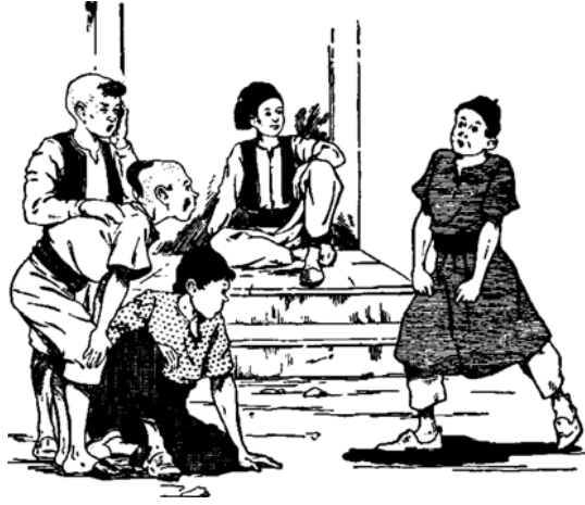
« طفل يتظاهر بإحضار جرة الزيتون ».

فَقَالَ لَهُمَا: «أَخْبِرَانِي — أَيُّهَا التَّاجِرَانِ — كَمْ سَنَةً تَسْتَطِيعَانِ أَنْ تَحْفَظَا الزَّيْتُونَ مِنْ التَّلْفِ؟»