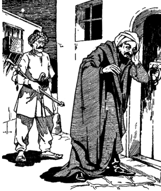
«الخليفة هارون الرشيد ووزيره جعفر يسيران في المدينة».