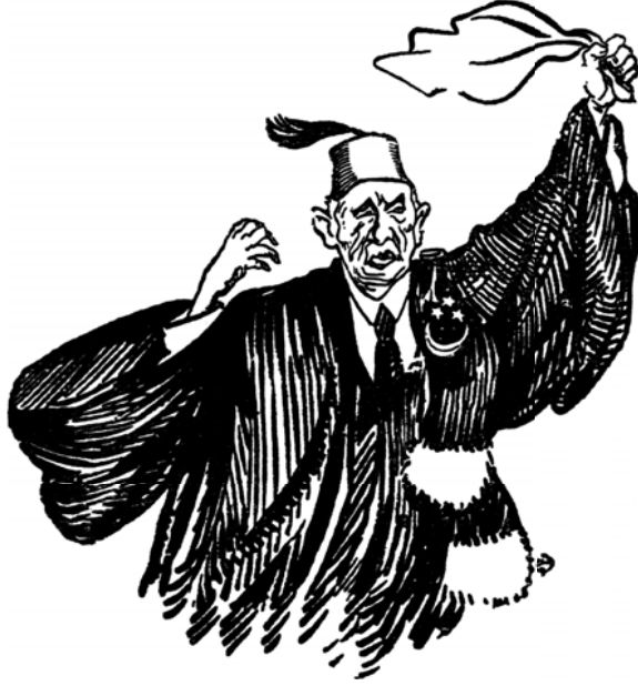
ثورة في هيكل رجل!