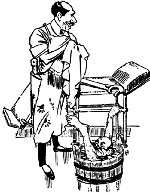
فيه شفاء للناس.

لو كان للجذع ده بخت ماكانش حد زيه في الدنيا!» يقول هذا في رضا وصدق نفس وراحة أعصاب! ... والواقع أنني لا أدري أكان هذا كله قد جاءه من طبيعة صفها الله من كل ما يتداخل أرباب الفنون، أم أنه تمكن من نفسه واستوثق من أنه لن يتعلق أحد بغيره مهما افتنَّ لإخوانه الجراحين في ألوان الشهادات! ثم هو شديد العطف على إخوانه الأطباء عامة، عظيم العون لجماعتهم، رطب اللسان فيهم.