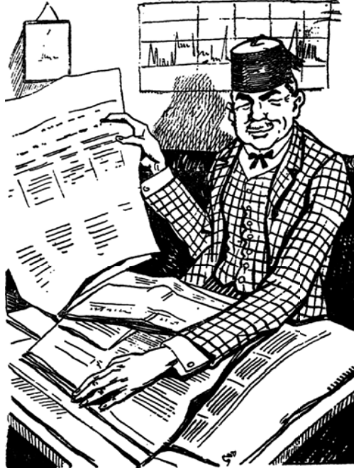
من ذخائر الأمم.

مالي في البلاد، لا أريد مؤلفًا ولا محاضرًا، وإنما أريد رجل عمل، أنقذ بمهارته ميزانية الدولة مرة، وكان قد أشرف بها سلفه على الدمار. وما يزال يعالج بتلك العبقرية الفذة ميزانية الدولة وزيرًا وعضوًا في مجلس النواب.