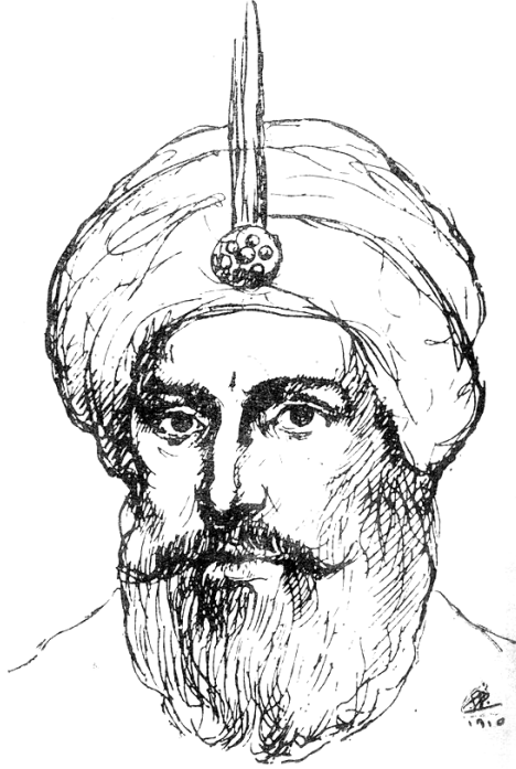
هارون الرشيد بريشة «جبران خليل جبران».