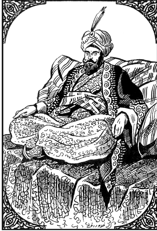
هارون الرشيد على أريكة الخلافة.