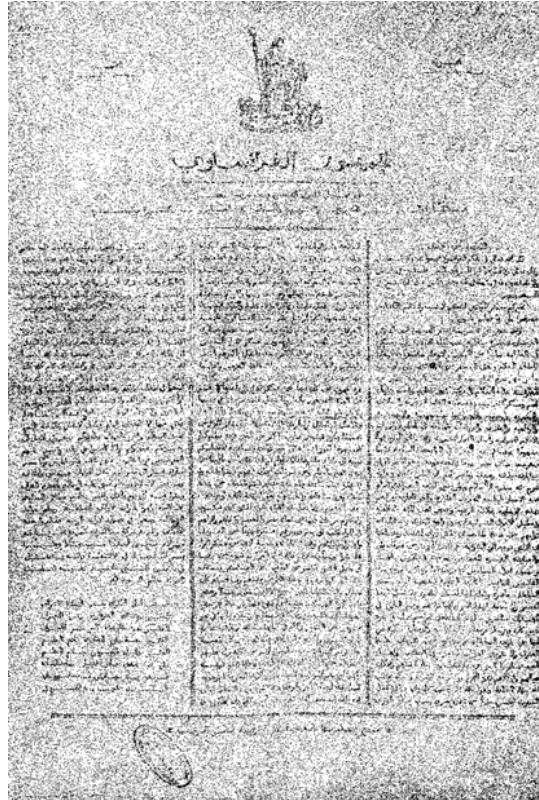
نص المنشور العربي.