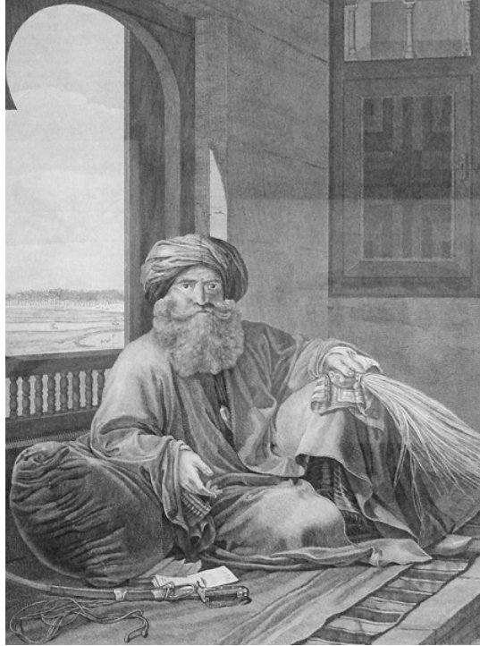
مراد بك «نقلًا عن كتاب مارسيل».

من الأعمال الطيبة الباقية الأثر والمنسوبة إلى مراد بك، أنه أصلح جامع عمرو بن العاص، بل وأوجهه من العدم، ومن الناس، من يعد له هذه المأثرة ويذكرها له بالمدح والثناء، وغريب أن يقوم رجل مثل مراد بك بهذا العمل الصالح إلا أن يكون له من ورائه مآرب، كاكْتساب قلوب الناس والجند، من المماليك بنوع خاص، ليستأثر بالأمر دون شريكه ومنافسه إبراهيم بك، وهناك روايتان، أو وجهتا نظر مختلفتان، في السبب الذي حمل مراد بك على ذلك العمل النافع، فالجبرتي، وهو شاهد عيان، وخبير بأحوال