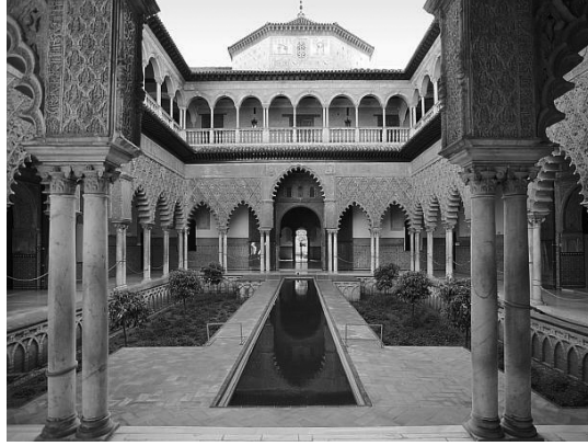
بهو للعداري بقصر إشبيلية.

يُبي هذا القصر، أو ما كان مكانه من قصر وحصن للسلطان الموحيدي أبي يعقوب يوسف (١١٨٤) فتهدّم في الحروب، وأعاد بناءه أيام الملك بطرس العاتي في القرن الرابع عشر، مهندسون وعمّال من المغاربة المتصرين Morescos.